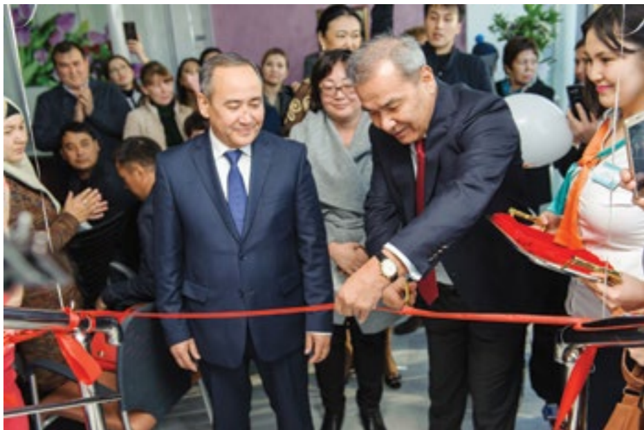
Открытие новой клиники «Экомед» в городе Шымкент. Ноябрь 2017 года.